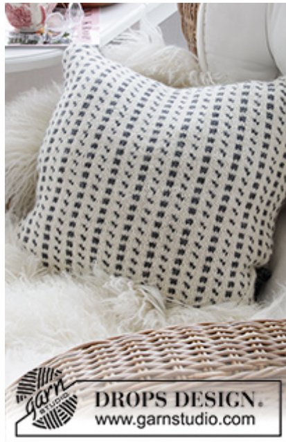
DROPS Extra 0-1521

Garnforbrug ved alternativt garn – Brug vores garn-omregner her